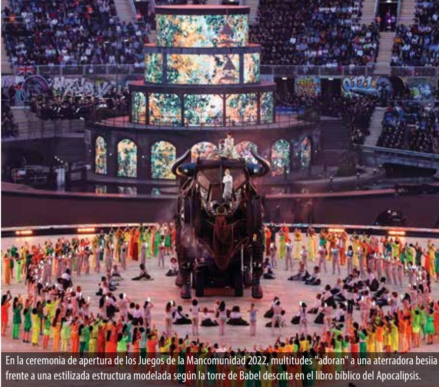
En la ceremonia de apertura de los Juegos de la Mancomunidad 2022, multitudes "adoran" a una aterradora bestia frente a una estilizada estructura modelada según la torre de Babel descrita en el libro bíblico del Apocalipsis.

¿Qué significa todo esto? ¿Qué tienen en común todas estas cosas? ¿Qué patrón o plan se está ejecutando ante nuestros propios ojos?