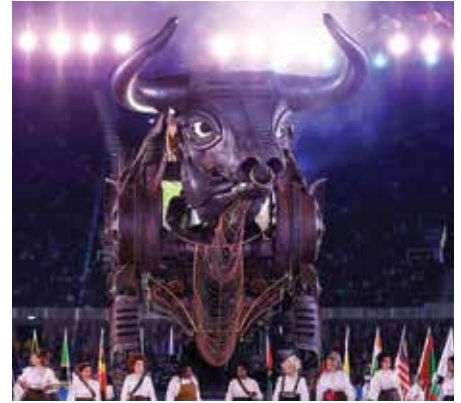
Izq.: El enorme altar de Zeus, preservado en el Museo de Pérgamo en Berlín, es probablemente “el trono de Satanás” mencionado en Apocalipsis 2:13. Der.: La escenografía de la ceremonia de inauguración de los Juegos de la Mancomunidad 2022, que incluyó una bestia gigantesca, se inspiró mayormente en el libro del Apocalipsis.