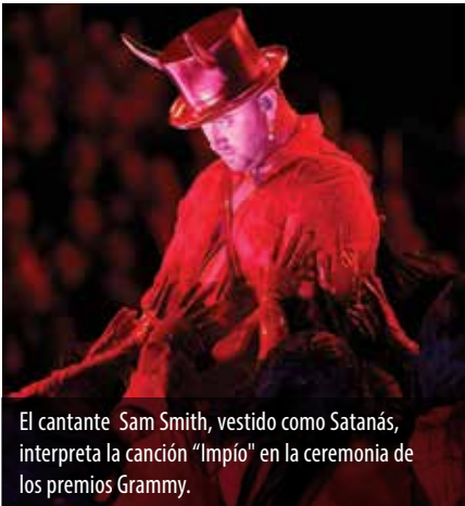
El cantante Sam Smith, vestido como Satanás, interpreta la canción "Impío" en la ceremonia de los premios Grammy.

¿Qué significa todo esto? ¿Qué tienen en común todas estas cosas? ¿Qué patrón o plan se está ejecutando ante nuestros propios ojos?