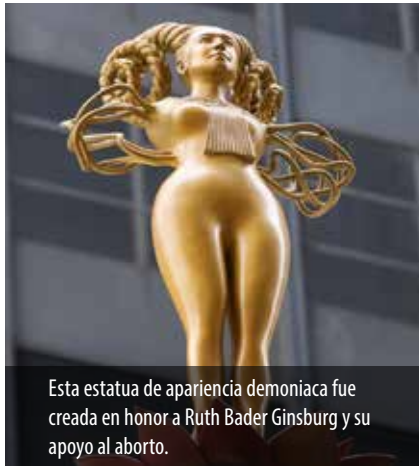
Esta estatua de apariencia demoníaca fue creada en honor a Ruth Bader Ginsburg y su apoyo al aborto.

parodia blasfema de "La última cena", el famoso cuadro de Leonardo da Vinci, en la cual los actores estaban completamente ataviados de negro.