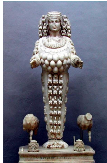
La Artemisa de Éfeso era la diosa de la fertilidad y se le representaba con múltiples pechos, una corona de forma de torres y una especie de nimbo detrás de la cabeza. La mitad inferior del cuerpo, de aspecto semejante al de una momia, estaba decorado con diversos símbolos y animales

Cuando Roma se convirtió en un imperio mundial es un hecho conocido que ella asimiló dentro de su sistema a dioses y religiones de todos los países paganos sobre los cuales reinaba. Como Babilonia era el origen del paganismo de estos países, podemos ver cómo la nueva religión de la Roma pagana no era más que la idolatría babilónica bajo diferentes nombres...más tarde, comenzaron a surgir mezclas del paganismo con la cristiandad”, ( “Babilonia, misterio religioso” , Woodrow, p. 13-17).