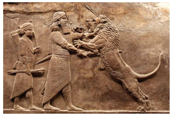
Nimrod: renombrado cazador, gobernante y constructor fundó la ciudad de Nínive y es una figura legendaria en la historia antigua. Noten tamaño de la figura en comparación con el león.