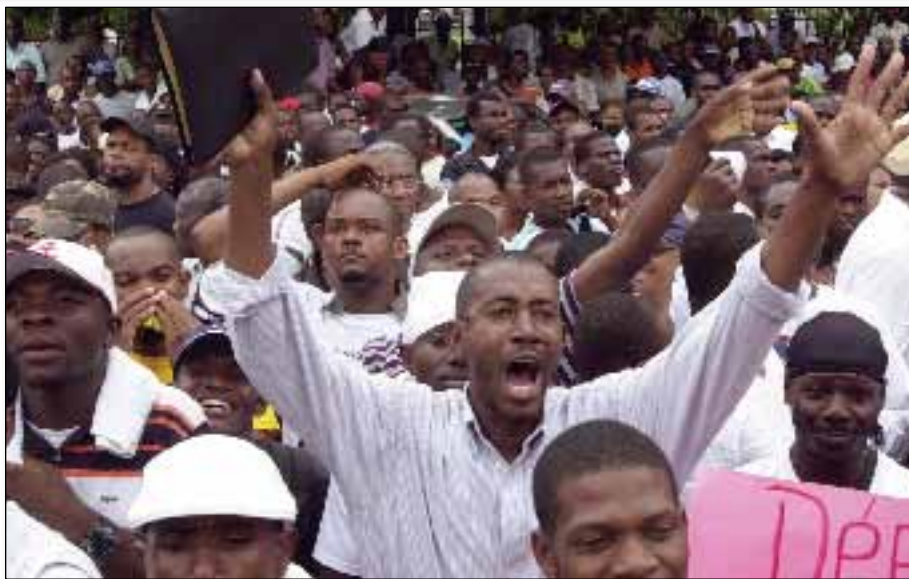
Haitianos se amotinan en Puerto Príncipe. El costo de los alimentos se ha duplicado en espacio de tres años, dando lugar a disturbios y violencia en Haití y en muchos otros países.

enfrentando la pérdida de las tierras que han pasado a través de varias generaciones familiares, se desesperan y algunos se suicidan.