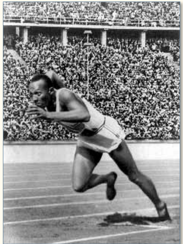
En las olimpiadas de 1936 el corredor Jesse Owens se ganó el título del ser humano más rápido de la tierra.