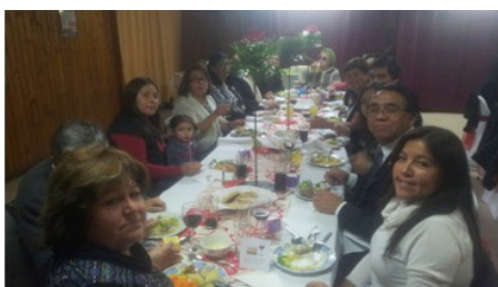
Noche de Guardar en Temuco