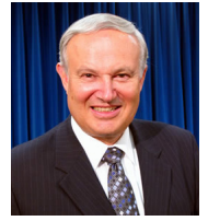
Por Mario Seiglie

Los cuatro evangelios constituyen una de las obras literarias más importantes en la historia de la humanidad, ya que se refieren a la vida de Jesucristo como Dios en la carne.