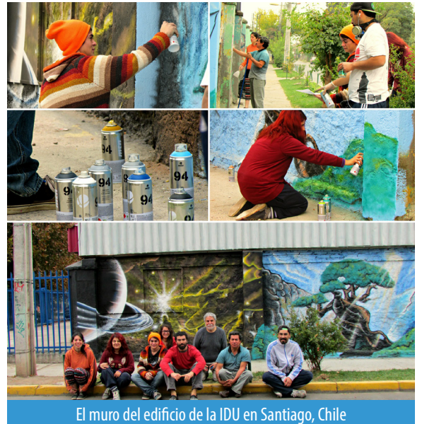
El muro del edificio de la IDU en Santiago, Chile

la oportunidad de mostrar nuestra literatura y regalar revistas Las Buenas Noticias a quienes se interesaron en ellas.