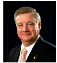
Por Peter Eddington

Debemos practicar la perfección que viene de Dios, pero no podemos practicar cualquier cosa que queramos. La práctica perfecta es la que hace la perfección.