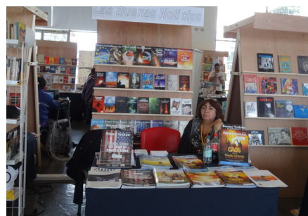
Nuestro puesto en la Feria del Libro

Nos trasladamos hasta esa localidad, en el sur de Chile, donde por tres días tuvimos