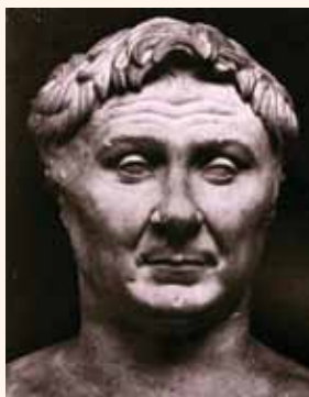
Pompeyo el Grande

Cuando el general romano Pompeyo entró triunfante en Jerusalén en el siglo primero a.C., estaba decidido a satisfacer su curiosidad sobre ciertas historias que circulaban en el mundo mediterráneo acerca del modo de adorar del pueblo judío. Después de conquistar la ciudad, uno de sus primeros actos fue entrar en el templo y descubrir la verdad detrás de las enigmáticas afirmaciones de que los