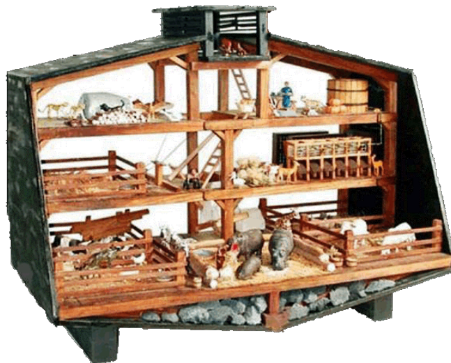
Vista interior del Arca de Noé